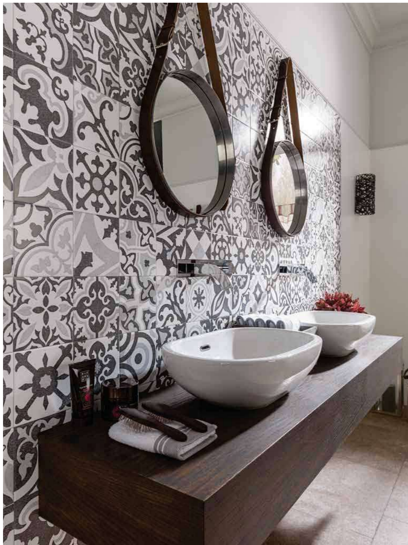
# BARCELONA E 31,6x90cm