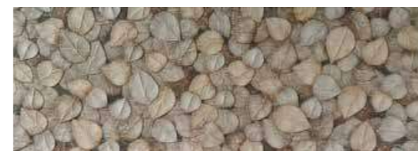
OXO GARDEN ARENA 31,6x90x1cm P3470611 / 100113367 Butech recomienda junta / Butech recommends joint: Colorstuk Rapid n Beige B22502016 / 100004308