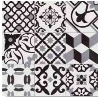
BARCELONA E S-R 59,6x59,6x1,1cm P1856975 / 100161220 G359 Butech recomienda junta / Butech recommends joint: Colorstuk Rapid n Cemento B22502004 / 100004297