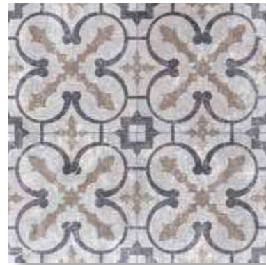
BARCELONA C S-R 59,6x59,6x1,1cm P1856959 / 100155911 G359 Butech recomienda junta / Butech recommends joint: Colorstuk Rapid n Antracita B22502005 / 100004298