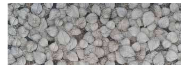
OXO GARDEN GRIS 31,6x90x1cm P3470612 / 100113368 Butech recomienda junta / Butech recommends joint: Colorstuk Rapid n Beige B22502004 / 100004297