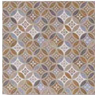
BARCELONA B S-R 59,6x59,6x1,1cm P1856961 / 100155910 G359 Butech recomienda junta / Butech recommends joint: Colorstuk Rapid n Cemento B22502004 / 100004297