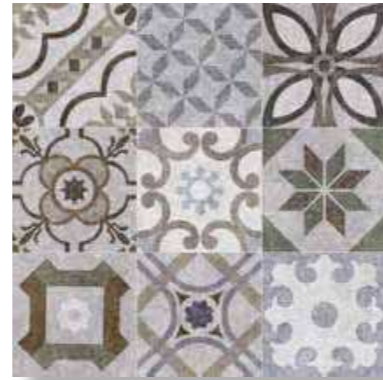
BARCELONA D S-R 59,6x59,6x1,1cm P1856960 / 100155912 G359 Butech recomienda junta / Butech recommends joint: Colorstuk Rapid n Gris B22502013 / 100004305