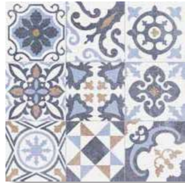
BARCELONA F S-R 59,6x59,6x1,1cm P1856977 / 100161457 G359 Butech recomienda junta / Butech recommends joint: Colorstuk Rapid n Cemento B22502004 / 100004297